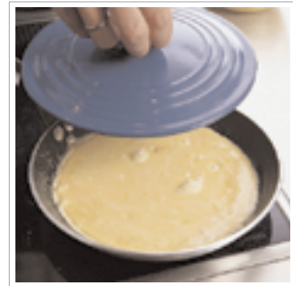
#6 og når låget tages af, kan man placere eventuelt fyld.