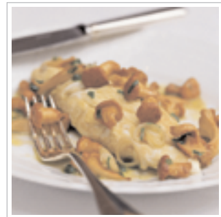
#9 Og den er klar til at blive pyntet og serveret.