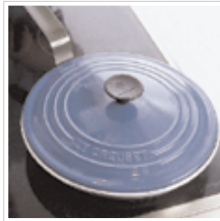
#5 Læg et låg på panden i to minutter,