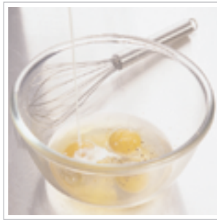
#2 Tilsæt salt, peber og mælk