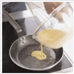
#4 Læg smørret på panden og når det begynder at bruse, hældes æggemassen på.