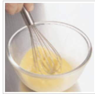
#3 og pisk det hele sammen.