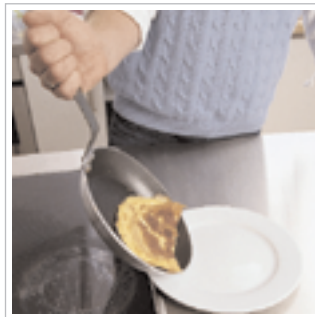
#8 Med et fast underhåndsgreb vendes omeletten ud på en tallerken.