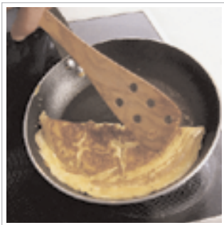
#7 Når omeletten er færdigstegt på bagsiden, foldes den på midten med en palet.