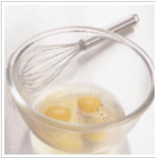
#1 Slå æggene ud i en skål.